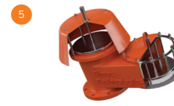
Válvulas de Alívio de Pressão e Vácuo