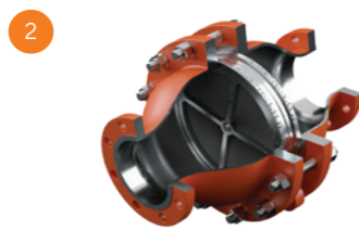
Corta-Chamas de Deflagração Em Linha LCA/LCB