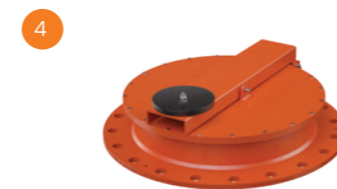
Respiros de Emergência