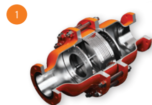
Corta-Chamas de Detonação Instável Em Linha UCA/UCB