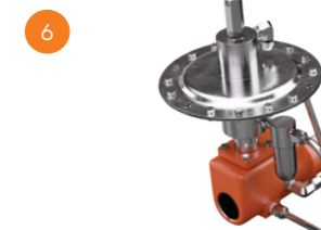
Válvula de Blanketing