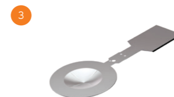
4 Discos de Ruptura