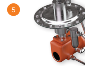
6 Válvula de Blanketing