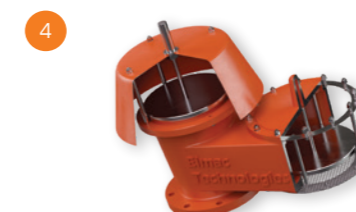
5 Válvulas de Alívio de Pressão e Vácuo